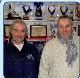
Gebr. Fanger Badhoevedorp